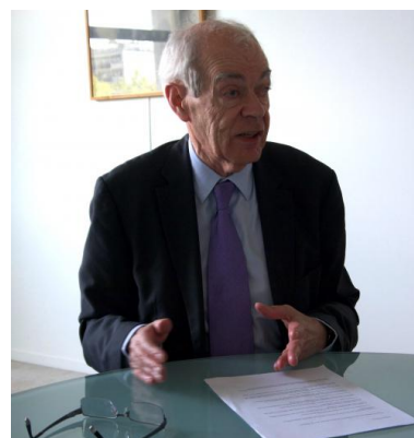
Jean-Marie Delarue © LF

travers un indice de tolérance. Il s'agit d'ausculter les opinions à l'égard des minorités ethniques et religieuses, pas les actes.